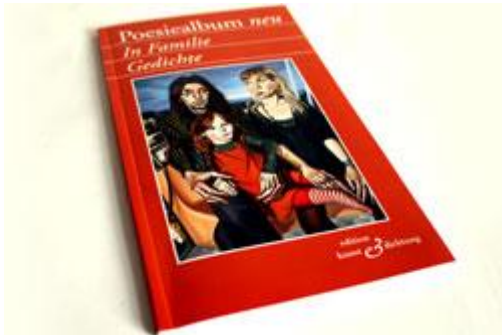
Poesiealbum neu "In Familie. Gedichte". Foto: Ralf Julke

Ralf Julke, Leipziger Internetzeitung, 18.12.2013